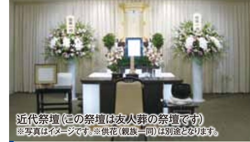
近代祭壇(この祭壇は友人葬の祭壇です) ※写真はイメージです。※供花(親族一同)は別途となります。