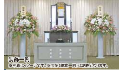
装飾一例 ※写真はイメージです。※供花(親族一同)は別途となります。