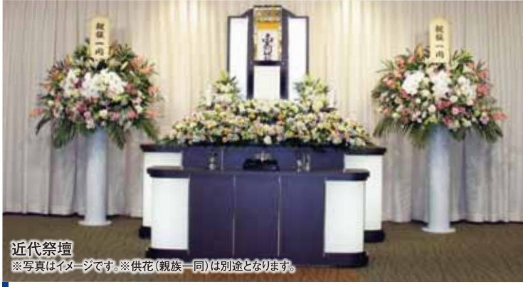
近代祭壇 ※写真はイメージです。※供花(親族一同)は別途となります。

他のご喪家と顔を合わせることがなく、完全なプライベート空間でゆったりと、大切な方との最後の時間を ご家族・関係者のみでお過ごしいただけます。