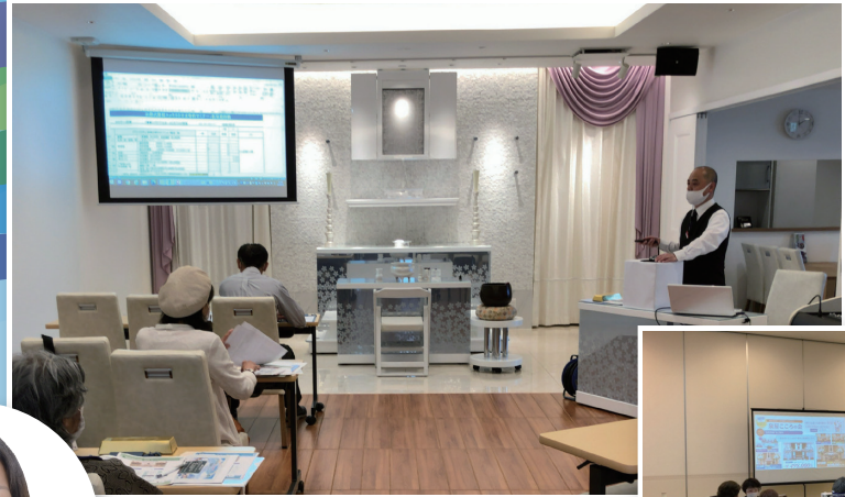
※写真は今回の会場とは異なります。