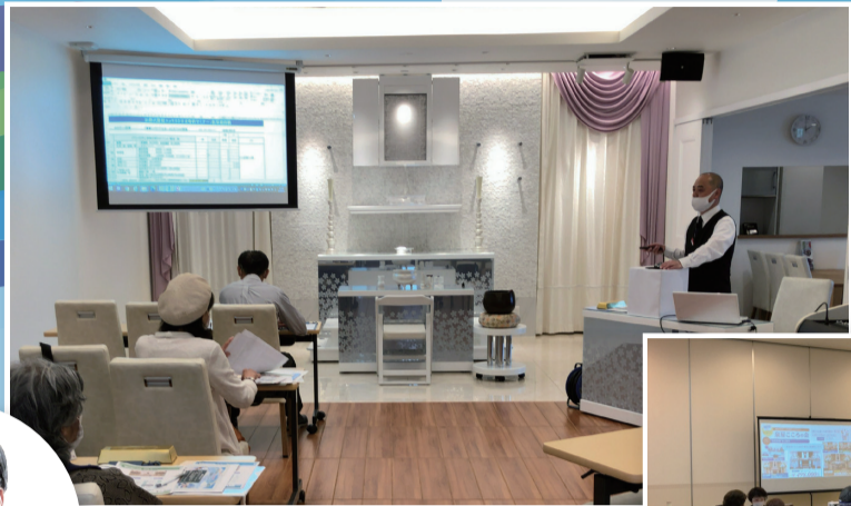
※写真は今回の会場とは異なります。