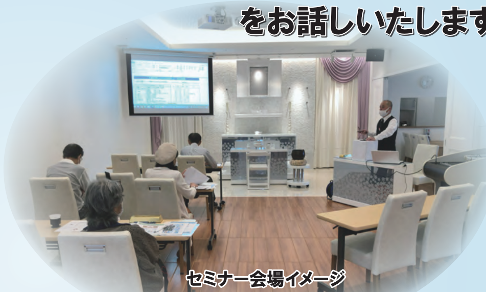
セミナー会場イメージ

ご都合の良い会場でご参加ください。 葬儀費用に関する資料請求だけでもOKです！お気軽にお問合せ下さい