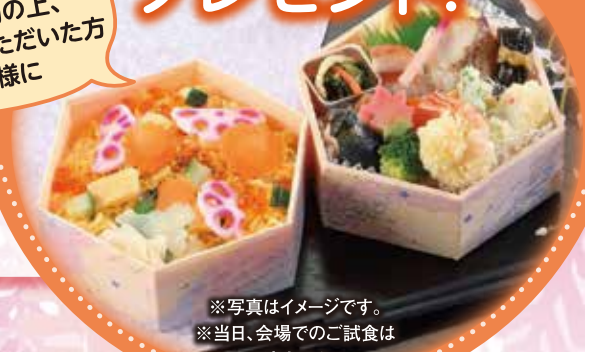
※写真はイメージです。 ※当日、会場でのご試食は できません。