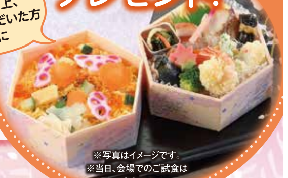
※写真はイメージです。 ※当日、会場でのご試食は できません。