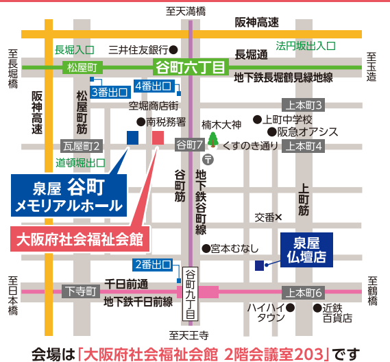
会場は「大阪府社会福祉会館 2階会議室203」です