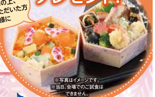
※写真はイメージです。 ※当日、会場でのご試食は できません。