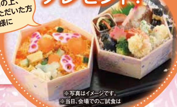
※写真はイメージです。 ※当日、会場でのご試食は できません。